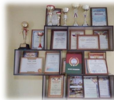
Награды ППО СПК «Коммунар»