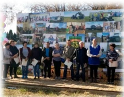
Награждение лучших работников

который в этом году уже дал первый урожай. Удмуртская республиканская общественная организация профсоюза работников АПК РФ поздравляет всех работников СПК «Коммунар» с юбилеем! желаем всегда урожайного года, хороших уродов и стабильного роста, крепкого здоровья, достойной оплаты труда!